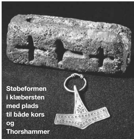
Støbeformen i klæbersten med plads til både kors og Thorshammer

Fra arkæologiske fund kender vi bl.a. til støbeforme fra smedjer, hvor man både kunne støbe amuletter formet som kristne kors, og bære disse om halsen - men i samme støbeforme findes også ofte en form til den hedenske Thors-hammer.