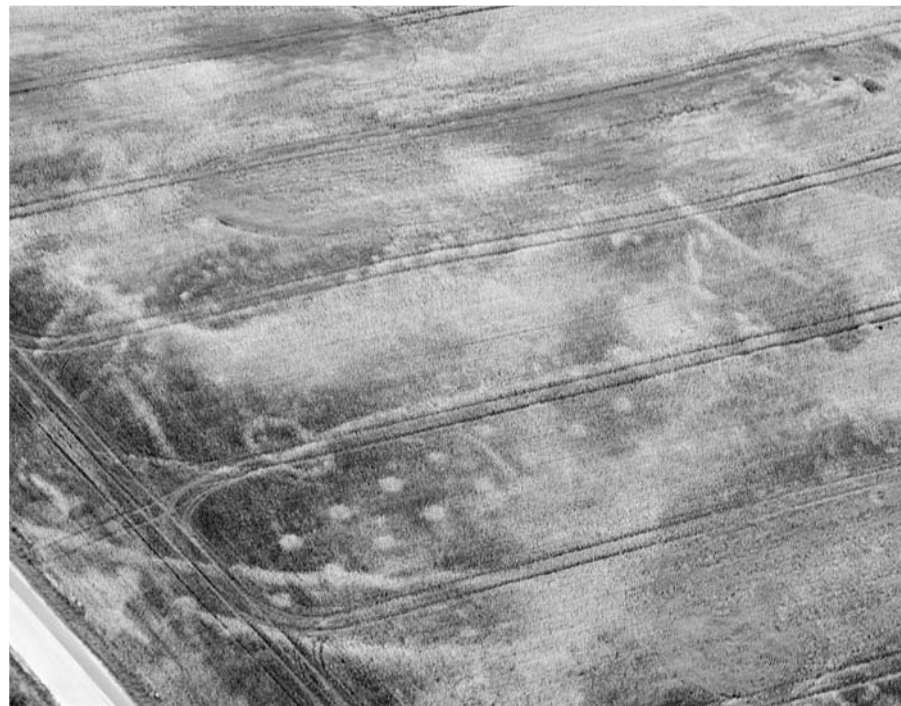
Luftfoto: Fra denne vinkel ses stolpehullerne tydeligt som hvide pletter af den vestligste bygning.

Tegningen er fra 1901 af Th. Hansen efter maleritegning fra 1796.