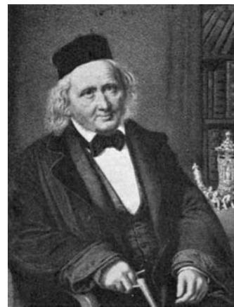
B. S. Ingemann - efter maleri af W. Marstrand

Og dette er endda kun en begyndelse. Dersom vi tager vores Gudstro alvorligt, må vi følge Betlehemsbarnet i dets opvækst og i dets senere voksenalv, helt