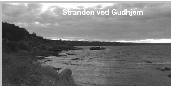
Stranden ved Gudhjem