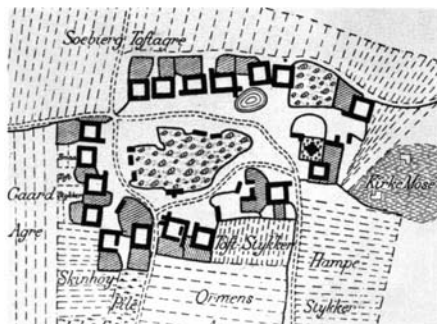
Plan over en landsby fra omkring midten af 1700-tallet. Gårdene er anbragt rundt om en åben plads, hvor bystævnet og gadekæret lå.

Sønnen bliver nemlig grebet af en streng og uforsonlig pietisme og ofrer sig så fuldstændig for denne tro, at han gifter sig med en langt ældre kvinde, som sekten vælger til ham.